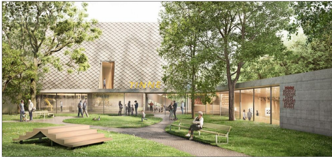
Im Bild eine grafische Illustration des Siegerprojekts. Sie zeigt den Hauptbau des Museums sowie den umlaufenden Sockelbau, der den Garten umfasst. Die Grünfläche bildet das Zentrum des Projekts. Ivo Corrà

„Dieses Projekt macht alles richtig, es schafft einen Ort für alle“, erklärte die Schweizer Ar-