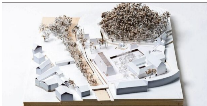
Im Bild ein Modell des Siegerprojekts, angesiedelt im Kapuzinergarten. Der Hauptbau verläuft parallel zum Tinnebach (Bildmitte). Das Dach des erdgeschossigen Sockelbaus wird begrünt und ist begebar.